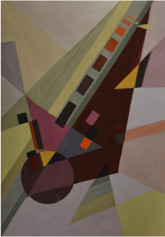
Іл. 4. Динаміка, тепла гама

Порядок проведення та критерії оцінювання вступних випробувань регулюється Положенням про організацію вступних випробувань у ДВНЗ “Прикарпатський національний університет імені Василя Стефаника”.