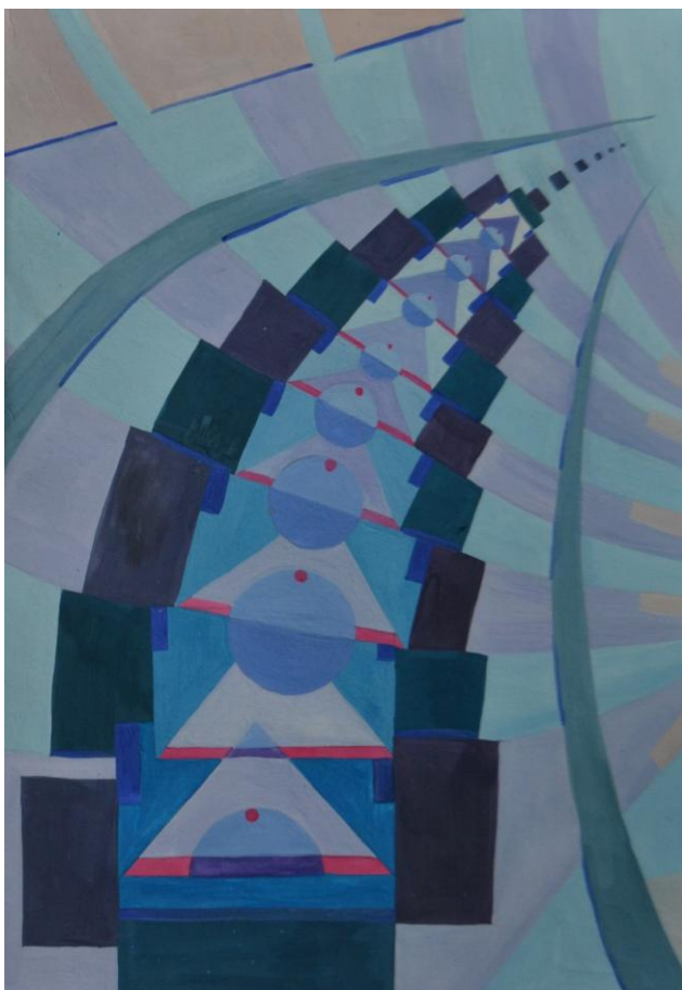
Іл. 3. Динаміка, холодна гама